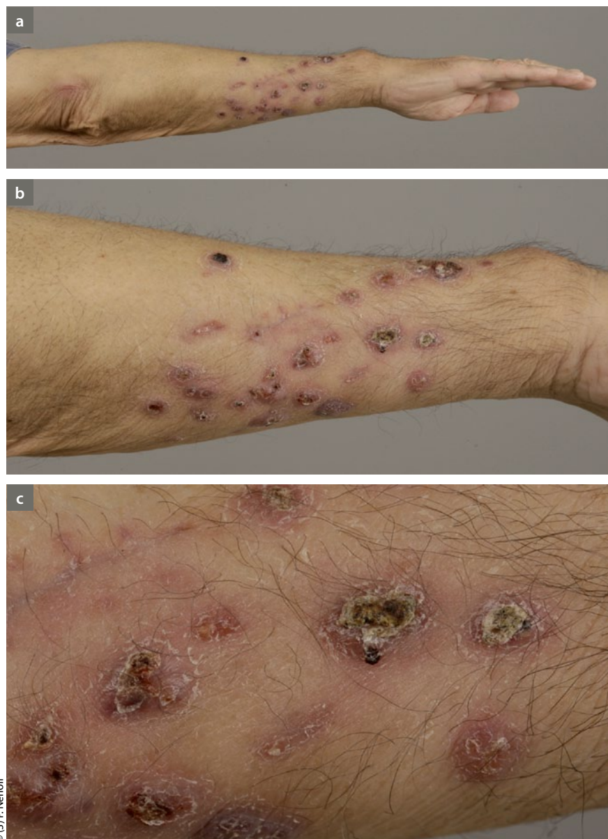
Abb. 1 a–c: Kutan-subkutane sporotrichoid fortgeleitete Mycobacterium-chelonae -Infektion am rechten Unterarm mit knotigen, erosiven, ulzerierten und verkrusteten Läsionen

Wegen der Unterschiede in der Antibiotika-Empfindlichkeit bei den verschiedenen NTM-Spezies (und u. U. auch innerhalb einer Spezies) sollte bei allen klinisch relevanten Stämmen (insbesondere bei Stämmen von Patienten mit