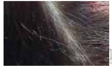
Abb. 2: Nissen im Haar einer 15-Jährigen

Allerdings haben einige Patienten schwere Verbrennungen nach der Anwendung eines Kombinationspräparats aus Dimeti-