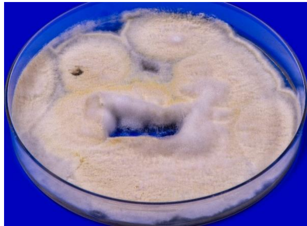
Abb. 1 Auf Sabouraud-Glukose-Agar entwickeln sich schnell wachsende Kolonien von Arthroderma (A.) tuberculatum mit granulär bis flauschiger, gelb-weißer Oberfläche

Der in der Umwelt ubiquitär im Erdboden vorkommende Pilz Arthroderma (A.) tuberculatum ist ein geophiler Dermatophyt. Taxonomisch wird A. tuberculatum , wie andere Arthroderma -Arten, in die Unterklasse der Eurotiomycetidae und die Klasse Eurotiomycetes eingeordnet. Diese gehören damit letztlich in die Familie Arthrodermataceae der Ordnung der Onygenales .