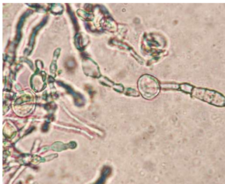
Abb. 5 Chlamydosporen von E. floccosum