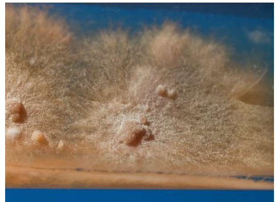
Abb. 2 E. floccosum : grünliche, flache und granuläre Kolonien auf Sabouraud-Glukose-Schrägagarröhrchen.

Sowohl auf Sabouraud-Glukose-Agar (alternativ Kimmig-Agar), als auch auf Mycosel-Agar, wächst der Dermatophyt mittelschnell, zunächst weiß. Aber schon nach wenigen Tagen nimmt der Thallus seine charakteristische grünlich-gelbe („olivgrüne“) Färbung an. Die Variationsbreite ist jedoch erstaunlich groß, so dass auch violette oder rosa gefärbte Isolate möglich sind. Die Kolonien sind gewöhnlich flach mit zentraler, knopfartiger Erhebung und durchzogen von radiären Furchen und Falten. Nach 10 d bei 30°C hat die Kolonie einen Durchmesser von 10-25 mm. Typisch ist der bereits nach drei Wochen einsetzende sog. Pleomorphismus, erkennbar an den weißen, watteähnlichen Luftmyzeflöckchen inmitten der Kolonien. Mit zunehmendem Alter und bereits nach wenigen Subkulturen wird der Pilz vollständig pleomorph