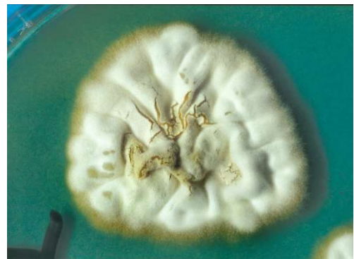
Abb. 3 Pleomorphismus, bei Subkultivierung wird der Thallus weiß durch Bildung von „sterilem“ Myzel, was bedeuten soll, dass kaum noch Makrokonidien vorhanden sind