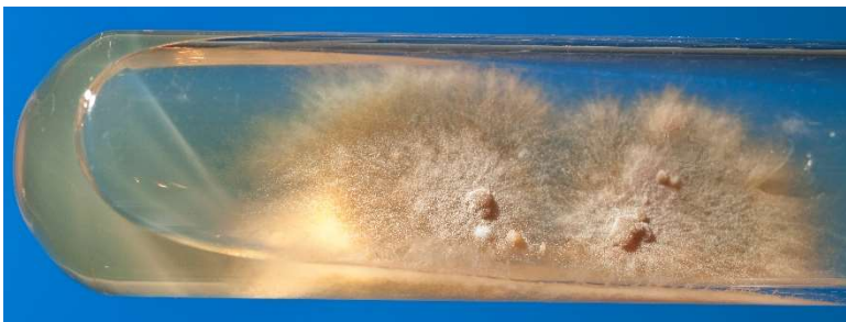
Abb. 1 Im Schägagarröhrchen entwickeln sich flache Kolonien mit zunächst weißer Farbe auf Sabouraud-Glukose-Agar.

Innerhalb der Gattung Epidermophyton (E.) ist E. floccosum die bisher einzig bekannte humanpathogene Art. Die Infektion durch E. floccosum tritt ausschließlich beim Menschen auf (anthropophiler Dermatophyt). Befallen ist vorrangig die glatte Haut, seltener auch die Nägel, niemals das Haar. E. floccosum ist ein obligat-pathogener Erreger, der in Mitteleuropa bei Tinea pedis und Tinea unguium nach T. rubrum und T. interdigitale am dritthäufigsten auftritt.