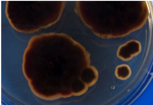
Abb. 2 Dunkelrotbraune Kolonieunterseite von T. rubrum var. raubitschekii auf Sabouraud 4 % Glukose-Agar.

Die Kolonieunterseite ist glatt, auffällig dunkelrotbraun bis fast schwarz gefärbt und bis auf einen schmalen weißlichen Randsaum durchgehend stark pigmentiert.